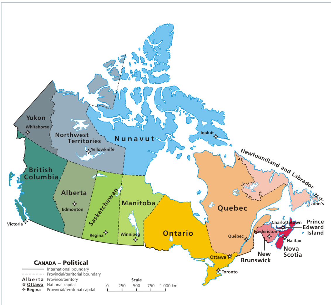
Imagen 2. División política, extraída de http://commons.wikimedia.org/wiki/File:Political_map_of_Canada.png?uselang=es .